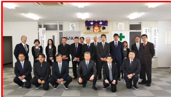
★★ 1月5日★★伊勢神社にて安全祈願を執り行いました。本年も安全第一でお願い致します