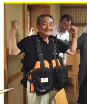
釣り用ベストを身につけガッツポーズ★★

さて、毎年恒例となりました安全標語も沢山の応募ありがとうございました。入選作品を紹介します。